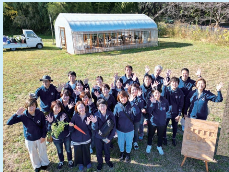
事務局メンバーでの合宿の一コマ。得意分野を持ち寄り、さまざまなプロジェクトを推進しています。

ライフイベントやキャリアステージに応じて、多様な働き方を行ったり来たりしながら、誰もが自律的にキャリアを築ける世の中にしていきたい。そんな思いから2017年1月、フリーランス協会は誕生しました。私たちがめざすのは、フリーランスによる、フリーランスのための、オープンでゆるやかなつながりを持ったネットワークです。一人ひとりとは独立した小さな存在でも、みんなで集まれば、さまざまなコラボレーションが生まれ、社会に対して声を届けやすくなります。誰もが自分らしい働き方を選択できる社会を実現するために、ぜひ一緒に、大きなムーブメントをつくっていきましょう!